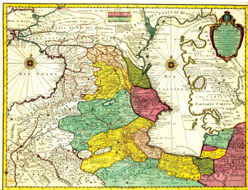
Fig. 10 – Guillaume Delisle's 1730 Map of the Caspian Sea and its Neighbouring Territories