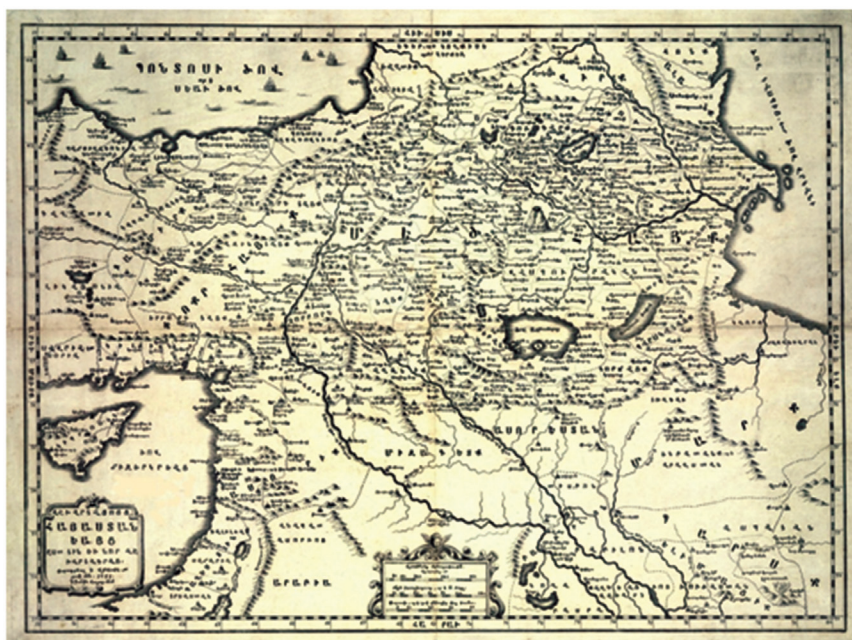
Fig. 11 – The Map of the Armenia as per the Ashkharhatsuyts printed in St. Lazzaro in 1751