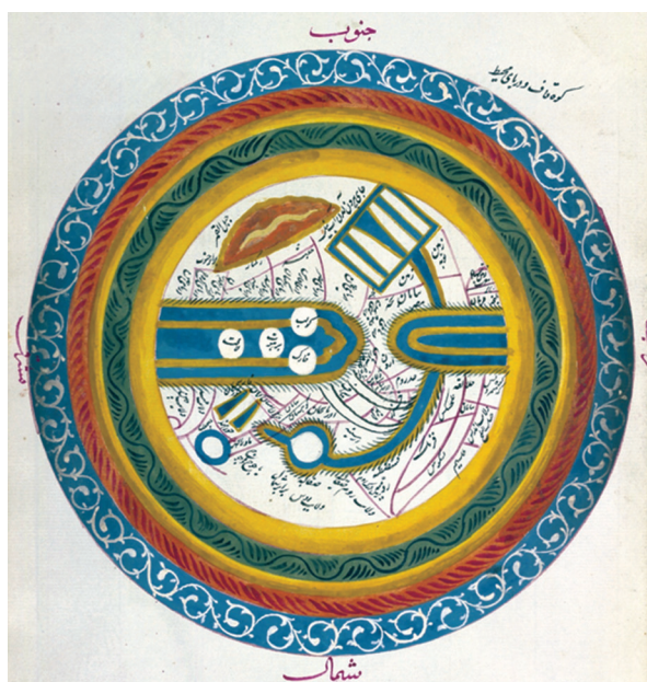
Fig. 6 – The tenth century World Map of al- Istakhri