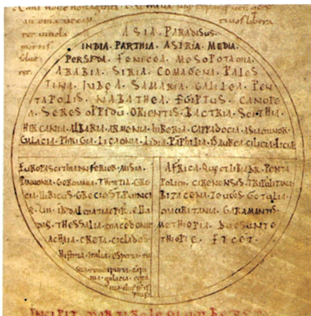
Fig. 4 – A typical T-O type European world map by Venerable Bede, from the 11th century England