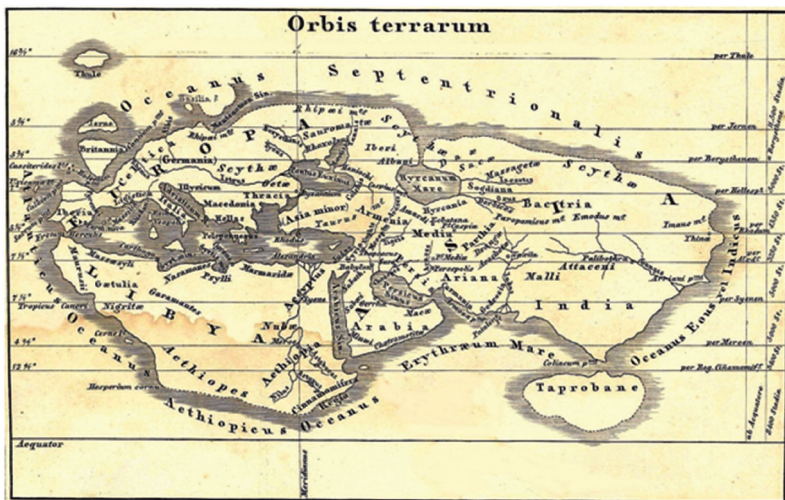
Fig. 1 – The World Map of Eratosthenes

С середины XVIII в. активную роль в развитии армянской картографии начинает играть конгрегация мхитаристов, в числе лучших образцов, выпущенных трудами членов конгрегации были карты Обетованной земли (1746 г.), исторической Армении (1751 г. и 1786 г.) и Османского государства (1787 г.) (рис. 14), а в 1849 г. был издан первый большой армянский атлас с двенадцатью цветными таблицами.