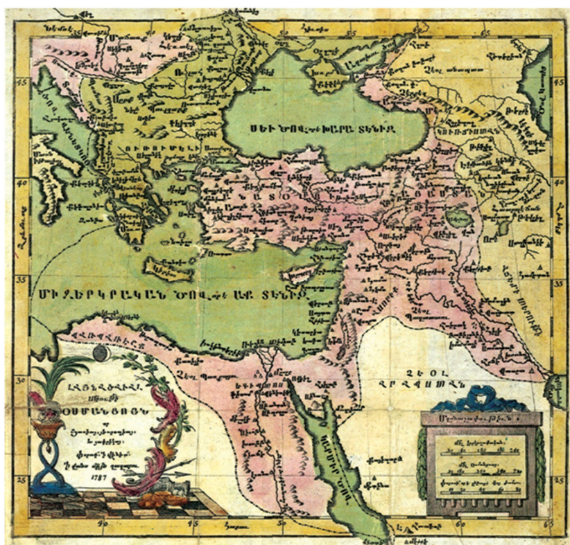
Fig. 14 – The map of the Ottoman Empire was printed in the Venetian Armenian Monastery of St. Lazzaro in 1787